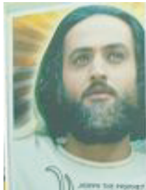
Syiah membuat lakaran gambar Nabi Yusuf

*Imam Ja'far as-Sadiq berkata: "Pada tanah perkuburan Husain a.s. terdapat penawar daripada segala penyakit dan ia adalah ubat yang paling besar." (Man La Yahdhuru al-Faqih j.2 hal. 600, Tahzib al-Ahkam j.2 hal. 26)