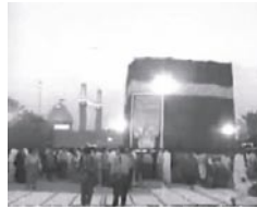
Kaabah yang dibangunkan Syiah di Karbala

*Imam Ja'far as-Sadiq berkata: "Pada tanah perkuburan Husain a.s. terdapat penawar daripada segala penyakit dan ia adalah ubat yang paling besar." (Man La Yahdhuru al-Faqih j.2 hal. 600, Tahzib al-Ahkam j.2 hal. 26)