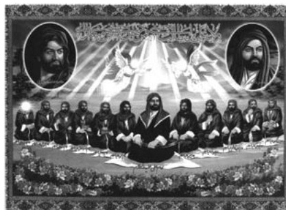
Lakaran Imam 12 Syi'ah

"Individu yang dikatakan Imam oleh golongan Syiah sebenarnya tidak pernah mengaku menjadi imam atau mengajar segala ajaran yang dipegang oleh Syi'ah. Mereka diangkat sebagai Imam oleh golongan Syiah sebagaimana orang Kristian mengangkat Nabi Isa a.s. sebagai anak tuhan (walhal Nabi Isa a.s. sendiri tidak pernah mengaku menjadi anak tuhan)."