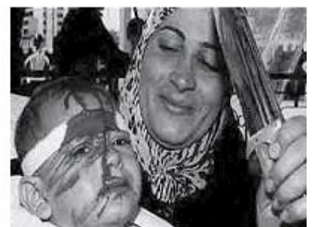
Gambar-Gambar Sekitar Perayaan Kufur Syi'ah Tatkala Menyambut 10 Muharram