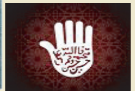
Simbol-Simbol Agama Syiah