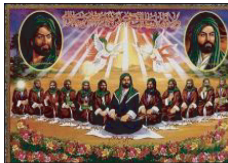
Lakaran Imam 12 Syi'ah

"Individu yang dikatakan Imam oleh golongan Syiah sebenarnya tidak pernah mengaku menjadi imam atau mengajar segala ajaran yang dipegang oleh Syi'ah. Mereka diangkat sebagai Imam oleh golongan Syiah sebagaimana orang Kristian mengangkat Nabi Isa a.s. sebagai anak tuhan (walhal Nabi Isa a.s. sendiri tidak pernah mengaku menjadi anak tuhan)."